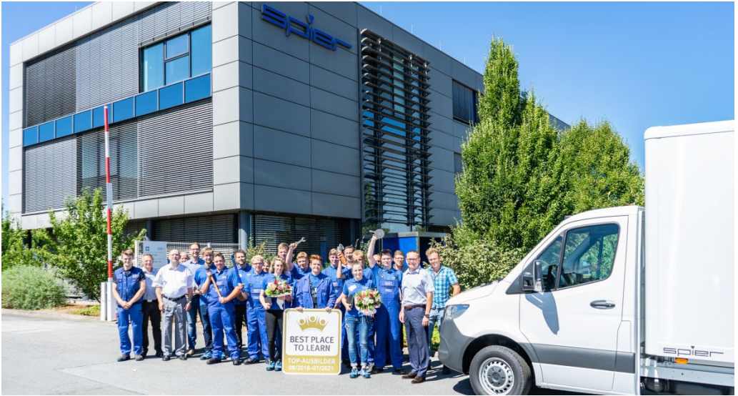
Im Bild: Begrüßung der neuen Auszubildenden