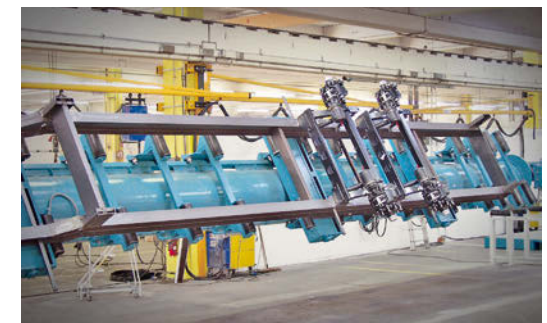
Fahrgestelle für Anhänger und Sattelanhänger werden in der eigenen Produktion gefertigt.