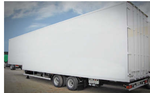
Zwei-Achs-Stufensattelanhänger mit Flügeltüren