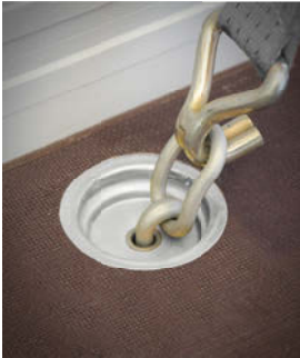
Bodenösen als Ladungssicherung