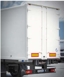
Heckportal mit Flügeltüren