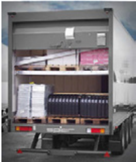
Heckportal mit Rolltor und Doppelstockbeladung