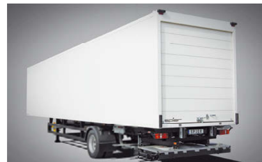
Ein-Achs-Sattelanhänger mit Rolltor und unterfahrbarer Ladebordwand