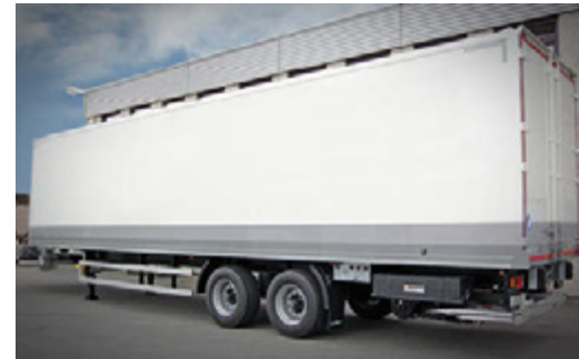
Zwei-Achs-Sattelanhänger mit Flügeltüren und unterfahrbarer Ladebordwand