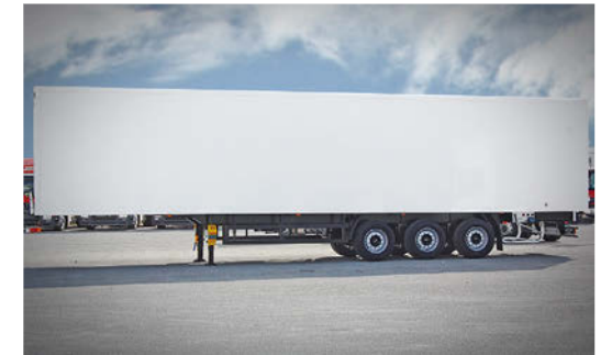
Drei-Achs-Sattelanhänger mit Flügeltüren