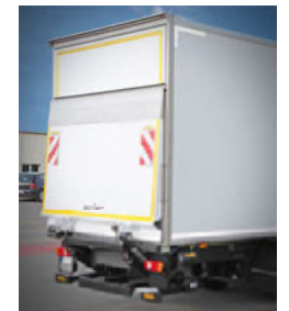
... mit LBW und Stellklappe