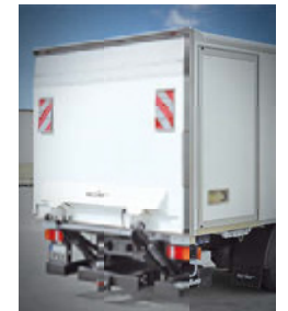
... mit abschließender LBW