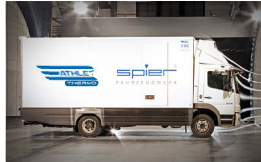
Der Athlet Thermo im Windkanal - ausgefeilte Aerodynamik sorgt für geringeren Kraftstoffverbrauch und weniger CO 2 -Emissionen.