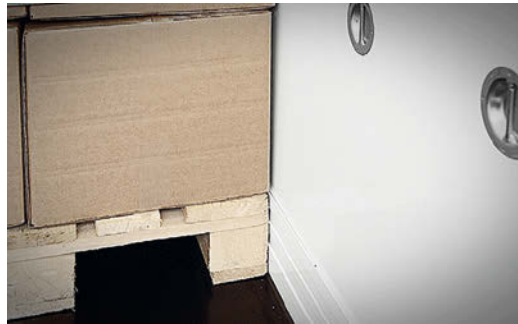
Einteiliges Bodenrahmenprofil mit integriertem Paletten-Anfahrerschutz