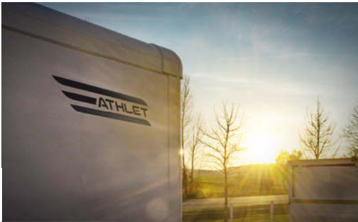
Einteilige durchgängige Einfassprofile im aeroform-Design reduzieren den Kraftstoffverbrauch.