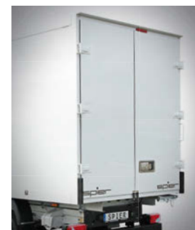
Heckportal mit Flügeltüren