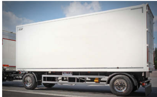
Drehschemel- oder Zentralachsanhänger mit Athlet Kofferaufbau