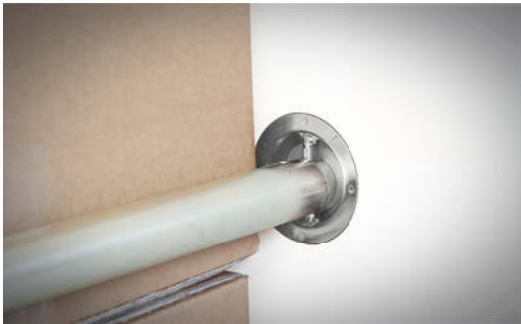
Ladungssicherung mit SPIER Zurrmulden und Absperrstangen