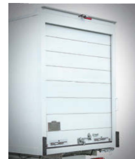
Heckportal mit Rolltor