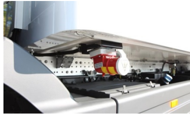
| korrosionsresistenter Unterbau