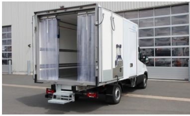
| stabiler Edelstahl-Heckrahmen