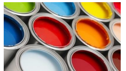
| Lackierung und Beschriftung