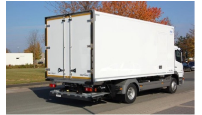
| verschiedene Ladebordwände