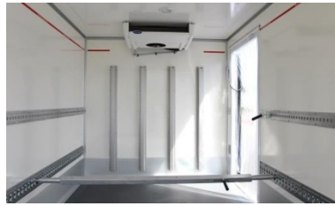
| flexible Ladungssicherungsmöglichkeiten