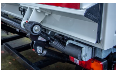
| Roll Buts