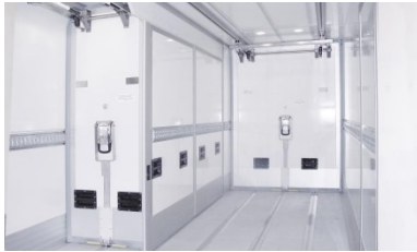
| individuelle Laderaumgestaltung