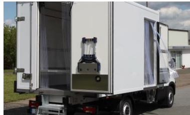
| Sackkarrenhalterung inkl. Sackkarre