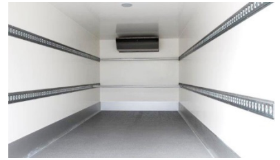
| verschiedene Ladebodenvarianten