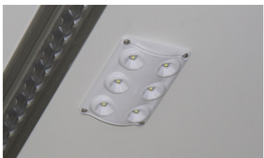
| zusätzliche Innenbeleuchtungen