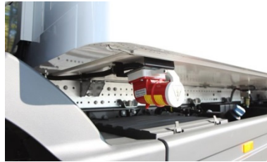
| korrosionsresistenter Unterbau