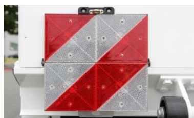
| Parkwarn- und Gefahrguttafeln